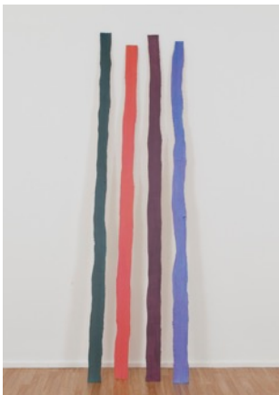
"Dominante", 2014, 4 Objekte - Öl auf Leinwand auf Holz, dimensions variable (300 cm Höhe)