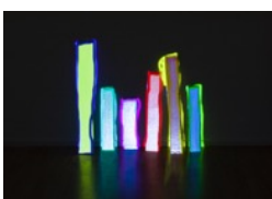
"Ganztonreihe", 2014, Video Installation, HD Video mit Ton, 6 Objekte - Acryl auf Leinwand auf Holz, Raum 300x500 cm