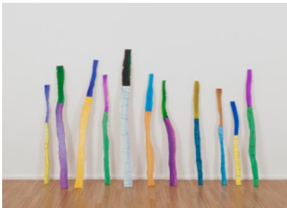
„11/2“, 2014, 11 Objekte - Öl auf Leinwand auf Holz + Diasec - Lambda Print auf Dibond, dimensions variable (170 cm Höhe)