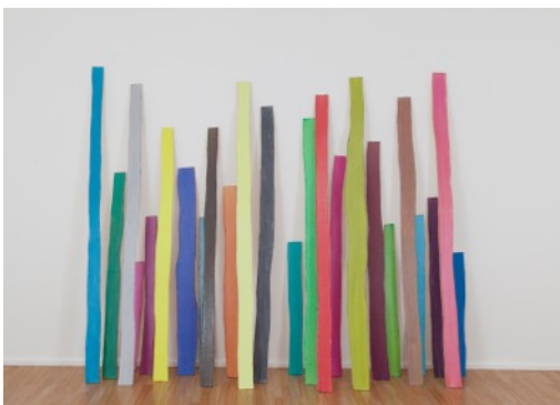
"Zwischentonreihe", 2014, 24 Objekte - Öl auf Leinwand auf Holz, dimensions variable (250 cm Höhe)